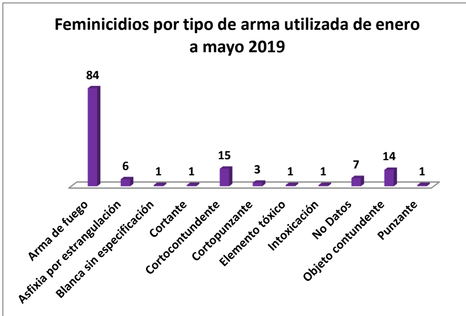
Figura 2. Feminicidios por tipo de arma utilizada, enero a mayo de 2019