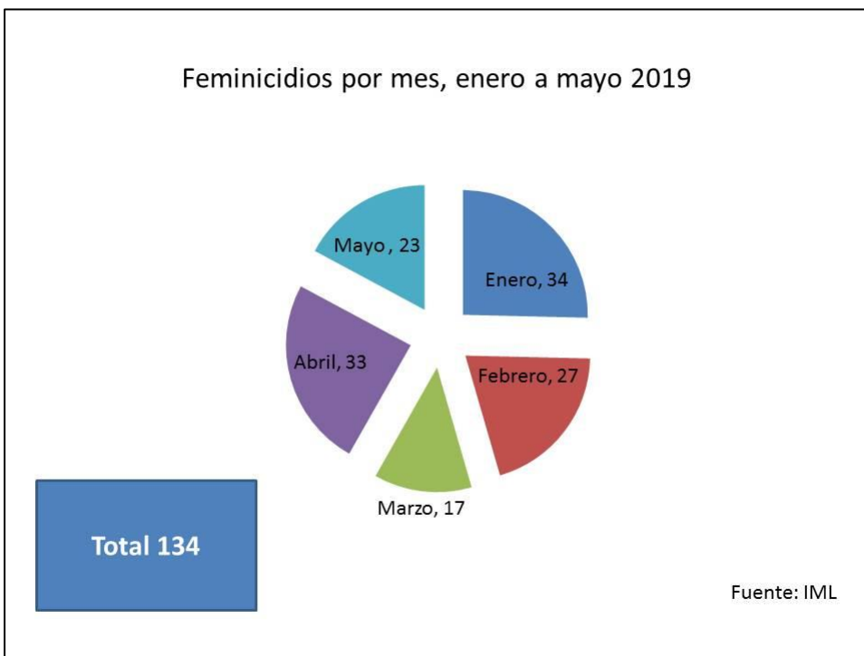
Figura 3. Feminicidios por mes de enero a mayo de 2019.