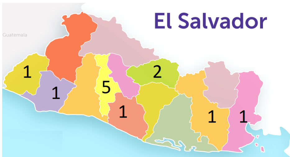
Feminicidios de niñas y adolescentes por departamento, enero- agosto 2020.